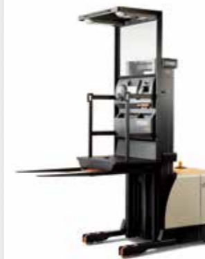
Series SP 3500/4000 Recogepedidos Capacidad de carga: 1,360 kg Altura de levante: de 3,450 a 9,295 mm

Disponible con: • Sistema de posicionamiento automático • Función de limitación automática