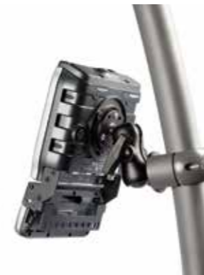
Soportes para accesorios