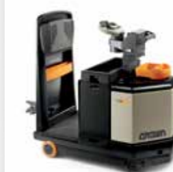
Serie TR 4500 Tractor de remolque Capacidad de carga rodante: 4,500 kg

Los pilares de los tractores de remolque de Crown son la tecnología innovadora y la construcción de alto rendimiento, que brindan control y potencia de remolque comprobada para las aplicaciones en centros de distribución, bodegas y producción.