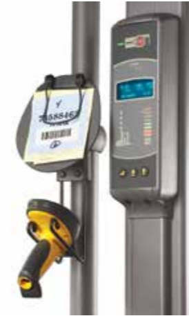
Almohadilla con sujetador/ Gancho para escáner