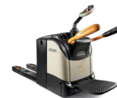
Serie WT 3000 Transpaleta con plataforma Capacidad de carga: 2,494 kg Plataforma: plegable o fija