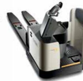
Serie PR 4500 Transpaleta de operador a bordo Capacidad de carga: 2,721 y 3,628 kg Horquillas: longitudes disponibles doble y triple