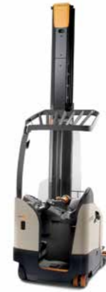
Serie RM 6000S Capacidad de carga: 2,000 kg Altura de levante: de 4,875 a 10,160 mm