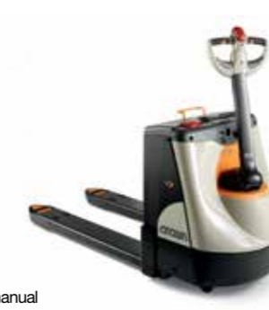
Serie WP 3000 Transpaleta de operador a pie Capacidad de carga: 2,000 kg