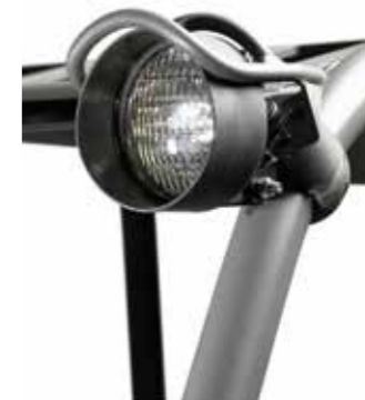
Luces de trabajo