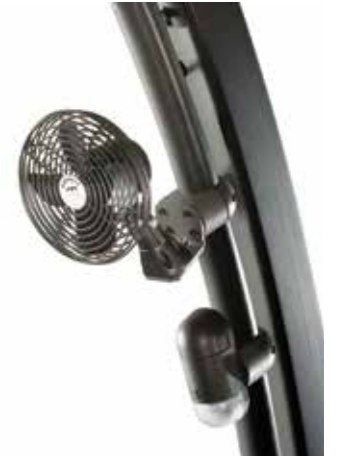
Ventiladores y luces