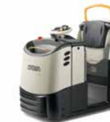
Serie TC 3000 Tractor de remolque Capacidad de carga: 3,000 kg