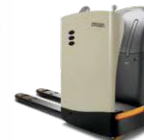
Serie RT 4000 Transpaleta de operador a bordo Capacidad de carga: 2,000 kg Horquillas: longitud doble disponible