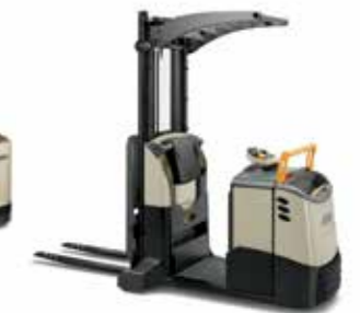
Serie MPC 3000 Recogepedidos con mástil Capacidad de carga: 1,179 kg Altura de levante: de 787 a 4,292 mm