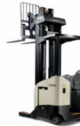
Serie RR 5700 Capacidad de carga: 1,600 y 2,000 kg Altura de levante: de 5,025 a 10,160 mm