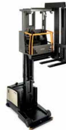
Serie TSP 6500 (ilustrada) Trilateral recogepedidos Capacidad de carga: 1,500 kg Altura de levante: de 4,900 a 13,485 mm

Crown puede optimizar el proceso de picking, ya sea sobre el suelo o a grandes alturas. El excelente rendimiento de manejo, la estabilidad y la ergonomía líder en la industria permiten que el operador trabaje de manera productiva y con seguridad.