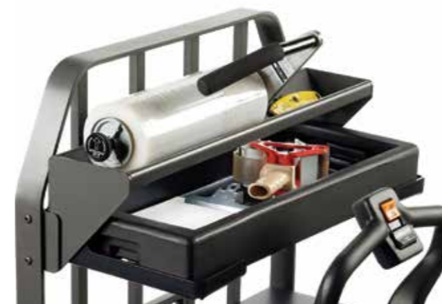
Bandejas de almacenamiento y para papel celofán de envoltura