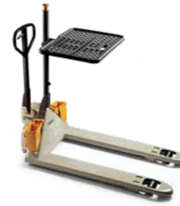
PTH con bandejas de carga y de almacenamiento