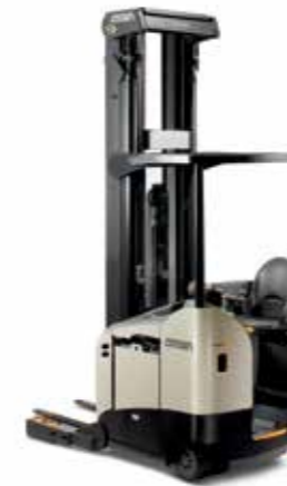
Serie RR 5700S Capacidad de carga: 2,000 kg Altura de levante: de 5,025 a 11,225 mm