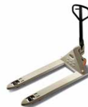
Serie PTH 50 Transpaleta manual Capacidad de carga: 2,300 kg