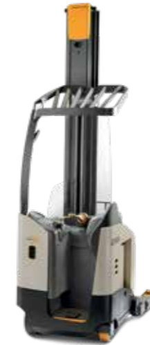
Serie RM 6000 Capacidad de carga: 2,000 kg Altura de levante: de 4,875 a 10,160 mm