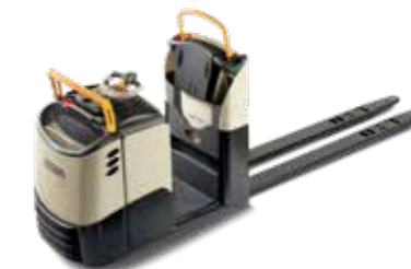
Serie GPC Recogepedidos de bajo nivel Capacidad de carga: 2,721 kg Plataforma de elevación disponible

Disponible con: • Sistema QuickPick Remote