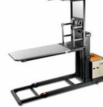
Serie SP 3570F Estabilizadores laterales Capacidad de carga: 1,360 kg Altura de levante: de 5,334 a 9,296 mm