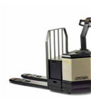
Serie PW 3500 Transpaleta de operador a pie Capacidad de carga: 2,721 y 3,628 kg