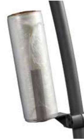
Soporte vertical para papel celofán de envoltura