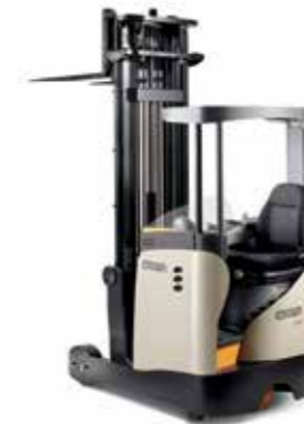
Serie ESR 5200 Capacidad de carga: de 1,400 a 2,000 kg Altura de levante: de 2,760 a 13,000 mm