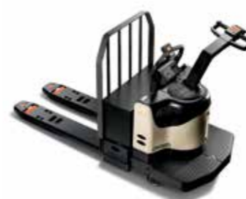
Serie PE 4000/4500 Transpaleta con control al final Capacidad de carga: de 2,700 a 3,600 kg Horquillas: longitudes disponibles doble y triple Dirección asistida disponible