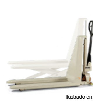
Levante de tijera manual PTH 50S Levante de tijera eléctrico PTH 50PS Transpaleta manual Capacidad de carga: 1,000 kg Altura de levante: 800 mm