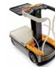
Serie WAV 60 Vehículo Work Assist Capacidad de carga: operador 135 kg, bandeja de carga 90 kg, carga en cubierta 115 kg Altura de levante de la plataforma: 2,995 mm