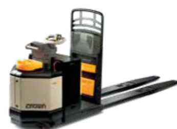
Serie PC 4500 Transpaleta con control central Capacidad de carga: de 2,700 a 3,600 kg Horquillas: longitudes disponibles doble y triple

Disponible con: • Sistema QuickPick Remote