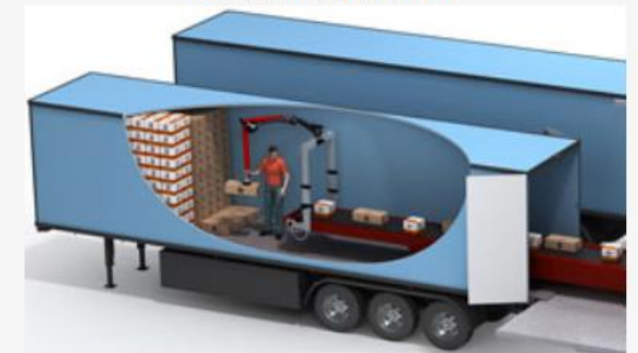
Operador trabajando con facilidad con Vaculex ParceLift