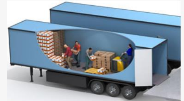
Operadores trabajando de forma manual sin Vaculex ParceLift