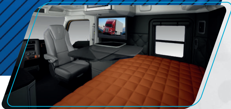
Comodidad a la hora del descanso

Con el sistema de telemetría Truck Tech Plus permite el diagnóstico remoto y oportuno de la operación del motor y su sistema de postratamiento, ahora con la funcionalidad Over The Air, permitirá realizar las actualizaciones de manera segura y sencilla, ya sea desde sus instalaciones o mientras se encuentre en ruta, sin tener que llevar la unidad a unos de los centros de servicio. Ahorrando tiempo, dinero y mantener más tiempo la unidad en el camino.