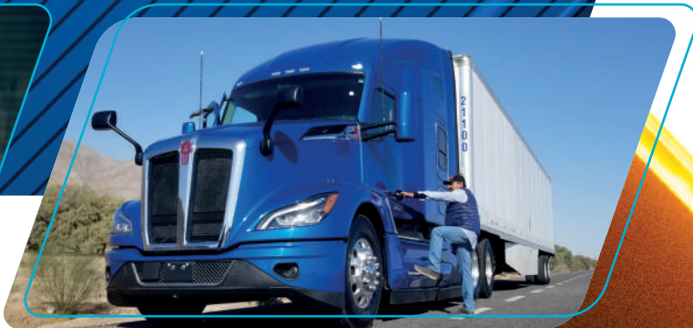
Acceso rápido y fácil a cabina

Los escalones para acceder a cabina son más amplios y seguros.