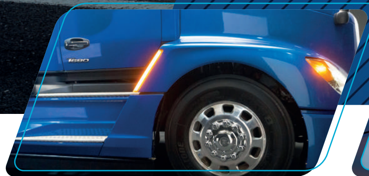
Línea de diseño aerodinámica