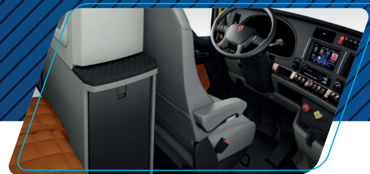
Amplitud y ergonomía