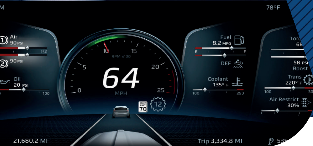
Innovadora pantalla digital de 15 pulgadas

La arquitectura tecnológica permite desde una conexión básica de Bluetooth hasta el flujo de información en tiempo real . El nuevo volante Kenworth SmartWheel combina sus controles intuitivos con la innovadora pantalla digital de 15 pulgadas y el nuevo sistema de instrumentación digital para una visualización perfecta y personalizable.