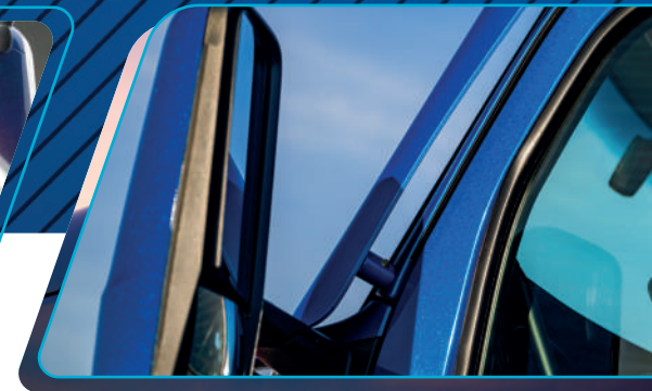
Espejos funcionales y duraderos